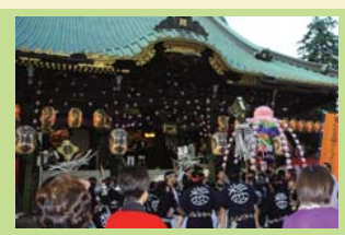
【東京】堀之内妙法寺