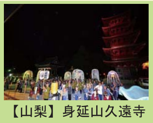
【山梨】身延山久遠寺