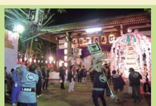
【東京】世田谷妙法寺